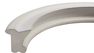
Dichtring für Druck- und Saugbetrieb Seals for delivery and suction operation

zertifiziert nach DIN EN ISO 9001 : 2008 Qualitätsmanagementsystem