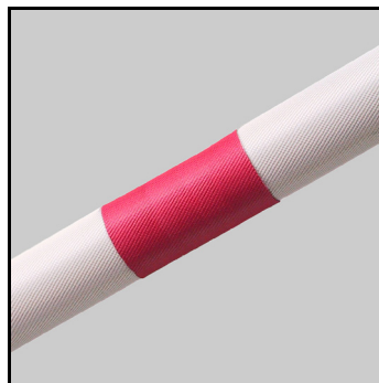
Leckageschieber dichtet das Loch ab