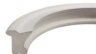
Dichtring für Druck- und Saugbetrieb Seals for delivery and suction operation

zertifiziert nach DIN EN ISO 9001 : 2008 Qualitätsmanagementsystem