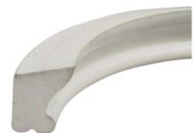
Dichting für Druckbetrieb Seals for delivery operation