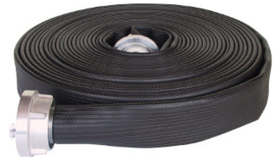
PROFI in schwarz