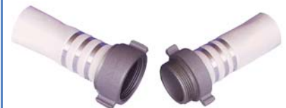
NST Kupplungen für Außeneinband mit Draht

andere Durchmesser auf Anfrage (Mindestmenge 500m)