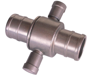
komplettes Paar complete pair