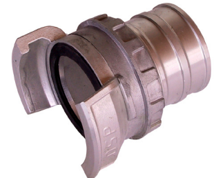
halbe Kupplung half coupling